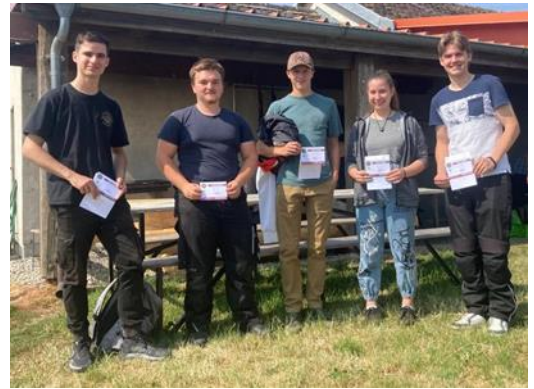
Notre groupe jeunes tireurs participant au tir organisé par la société de tir de Ballens, ils ont chacun remporter une distinction!